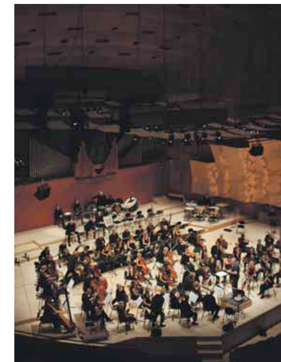
Copenhagen Phil spiller uddrag af Astor Piazzollas The Four Seasons of Buenos Aires .

The Four Seasons of Buenos Aires består af fire forskellige dele skrevet mellem 1965 og 1970. Piazzollas værk siges at indfange Buenos Aires' hverdagsliv på en særligt indlevende og medrivende måde; musikken af den anarkistiske trafik, den daglige galskab og nattens fester. Døm selv, når vi varmer op med The Four Seasons of Buenos Aires i VEGA 13. november.