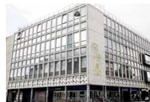
VEGA - Folkets Hus

Da bygningen blev opført i 1956 var det under navnet 'Folkets Hus – et mødested for alle', og rummene var tiltænkt den danske fagbevægelse. VEGA er opført i en jernbeton-skeletkonstruktion med et kraftigt relief i facaderne, der giver bygningen den lethed og robusthed, der karakteriserer hele huset. Vilhelm Lauritzen stod selv for de mindste detaljer indenfor jernbeton-konstruktionen: Håndtag, lysekroner, og møbler blev detaljeteget, og de mange træpaneler blev fra savværket nummereret, så træårene kunne fortsætte fra panel til panel. Smukt, simpelt og svævende. I dag er huset blevet musikens hus, men dets funktionalistiske design og detalje er bevaret. Lauritzens perfektionisme er stadig til stede i de minimale, men svungne trægelandre og unikke trappeløb samt de æstetiske sale – akkurat som i Konservatoriets Koncertsal, det gamle radiohus, hvor Copenhagen Phil holder til.