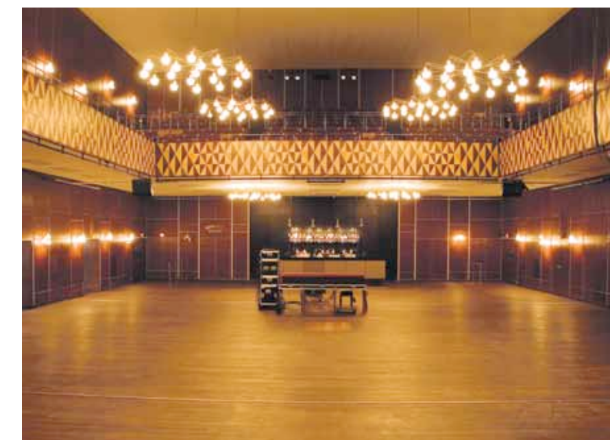
Koncertsalen i store VEGA

Kunstneren Bjørn Nørgaard indstillede huset til fredning, da han var formand for 'Det Særlige Byggesyn'. Og det var daværende miljøminister Svend Auken, der valgte at gøre det tidligere Folkets Hus til Danmarks yngste fredede bygning i 1996.