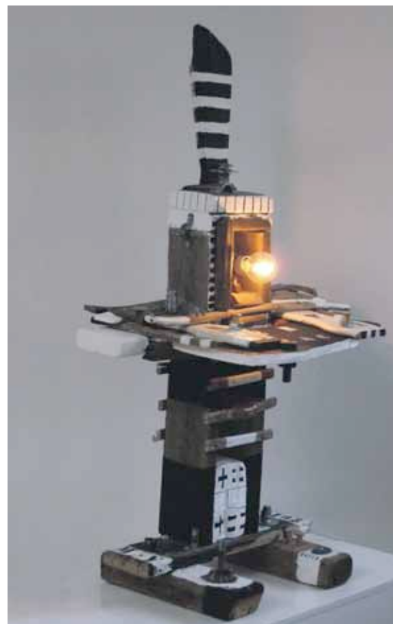
Serve Peace er én af de installationer, du kan opleve i VEGA.

Det vigtigste for mig er, at publikum indtager værkerne uden for mange forklaringer. Og det bedste er, når jeg kan bygge illusioner – altså vise noget, der ikke er. Efter min mening, kan en kunstner ikke styre beskueren, idet kunstoplevelsen jo altid er individuel – der er ingen, der er ens. Man indtager forskelligt alt efter, hvem man er. Selvfølgelig er der områder, du gerne vil have en dybere forståelse for, og dermed giver en konkret. Jeg har arbejdet med skulptur, collage, møbler, lys, billeder, osv. Den senere tid er jeg begyndt at arbejde mere og mere med interaktive værker, hvor publikum spiller en mere aktiv rolle. Jeg kan godt lide, når publikum selv finder noget, de kan genkende i sig selv.