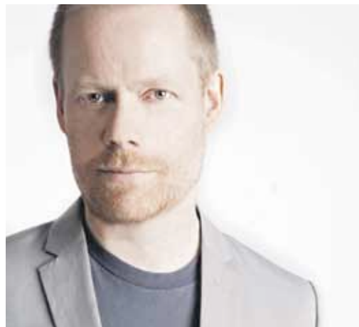
Max Richter

andre dele af værket er Richters egne. De steder, hvor Richter slet ikke har ændret i moderne i Vivaldis partitur, har han i stedet leget med rytmen ved fx at forlænge eller forkorte enkelte passager. I Sommer høres Vivaldis violiners insisterende og korte toner tydeligt. Men intet er som det plejer! Strygerne begynder at danse i loops på et lag af en dyb elektronisk ambiens. Det er svært ikke at lade sig rive med af en sådan gammel flamme, der har udviklet sig og er blevet mere moderne siden sidst! En dynamisk gentagen bas mærkes tydeligere i brystkassen. Tempoet i Vinter er også mærkeligt forandret; næsten uhyggeligt langsomt. Men det er Vivaldis vintermelodi, som strygerne spiller. Richter har revet det hele fra hinanden og tilsat en underliggende flygtig harmoni på en bund af mørk electronica. Når man lytter, er det bare om at hægte sig fast, før han tager fat på næste årstid!