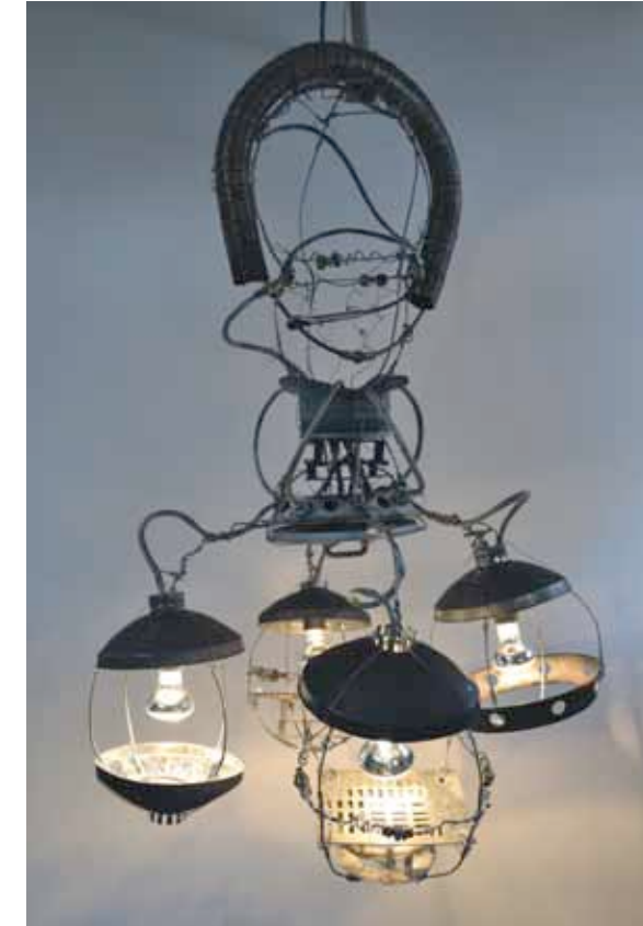
Octopus Foto / Mikala Valeur

Jeg arbejder på en installation i det offentlige rum, da det er en meget naturlig indgang til publikum. Kunstværker skal have et publikum, for uden publikum bliver kunsten ikke formidlet og set. Grundfundamentet i dette værk er derfor en puls, som sættes i gang af borgerne, og dermed giver de liv til værket. Værkets udtryk og liv er afhængigt af borgerne og byens aktivitet dag og nat. Installationer i det offentlige rum er oftest set i en større sammenhæng, og værkerne bliver dermed en del af rummets samlede aktivitet og billede. Et værk kan med tiden blive et naturligt element i byen og sammen med byrummet være med til at give hverdagen historie. Mit kunstværk, Kunsten ta'r pulsen på KBH , er et kubistisk værk med en levende puls, som har tre rytmer, der aktiveres i forhold til borgernes aktivitet omkring værket: hvilepulsen, den rolige puls og stresspulsen. Pulsens 3 rytmer løber forskelligt afhængigt af, hvor meget aktivitet, eller hvor mange borgere, der bevæger sig omkring eller forbi værket. På den måde bliver