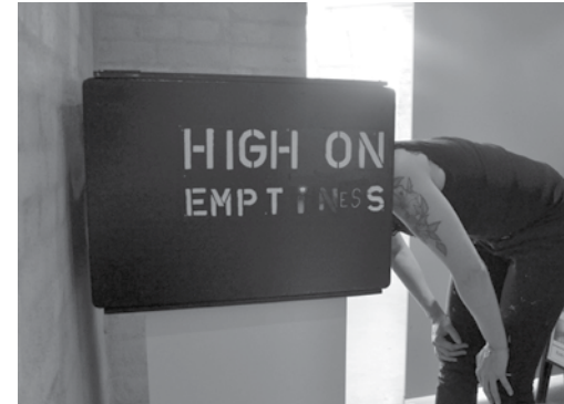
Placér dit hovede i Mikala Valeurs Mørkekammer - hvis du tør?