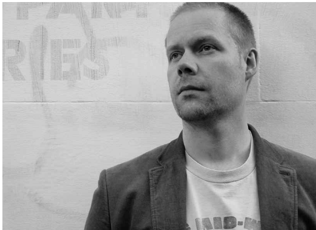
Max Richter